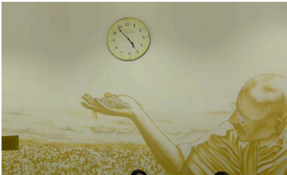
Lieu de la session : Salle Gandhi, Maison des Associations - Genève

INTERNATIONAL TRAINING CENTRE ON HUMAN RIGHTS AND PEACE TEACHING